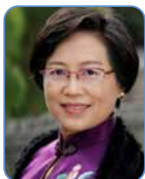
章秋 教授 中华医学会糖尿病学分会糖尿 病教育与管理学组组长 安徽医科大学第一附属医院内 分泌科主任