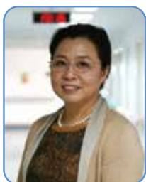
郭晓蕙 教授 中华医学会糖尿病学分会糖尿病 教育与管理学组顾问 北京大学第一医院内分泌科