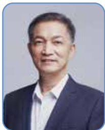
朱大龙 教授 中华医学会糖尿病学分会主任委员 南京鼓楼医院内分泌代谢病医学中心主任