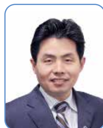
孙子林 教授 中华医学会糖尿病学分会糖尿病 教育与管理学组学组顾问 东南大学糖尿病研究所所长